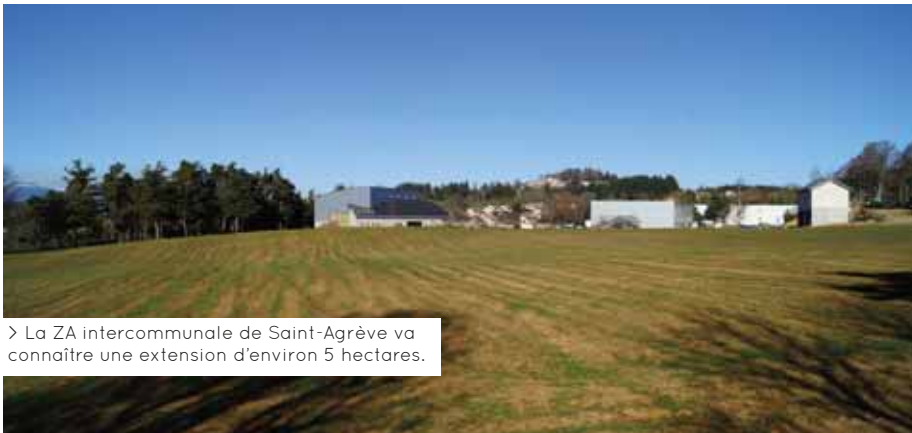
> La ZA intercommunale de Saint-Agrève va connaître une extension d'environ 5 hectares.

La communauté de communes Val'Eyrieux reprend le projet d'extension de la zone d'activité de Rascle située à Saint-Agrève. L'objectif est d'offrir de nouvelles possibilités foncières pour l'accueil de plusieurs entreprises. Le site pourrait ainsi répondre aux sollicitations de l'entreprise Mecelec qui souhaiterait se développer sur Saint-Agrève.