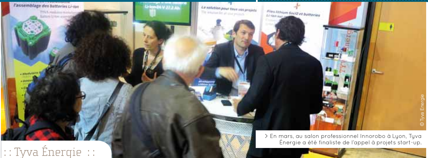
➤ En mars, au salon professionnel Innorobo à Lyon, Tyva Énergie a été finaliste de l'appel à projets start-up.