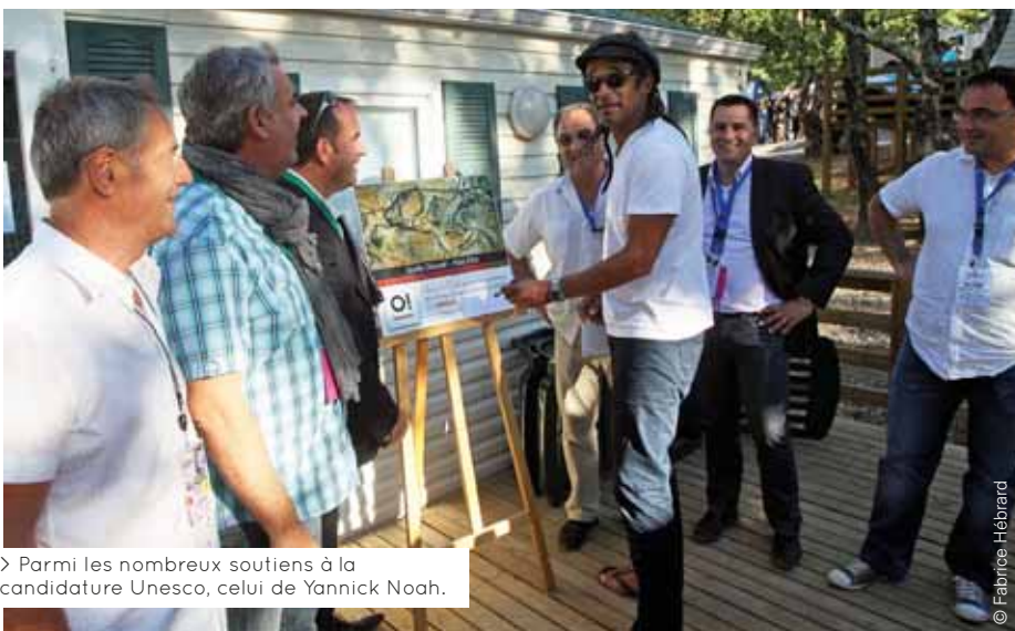
> Parmi les nombreux soutiens à la candidature Unesco, celui de Yannick Noah.

+ d'infos auprès de l'office de tourisme de Vallon-Pont-d'Arc, tél. 04 75 88 04 01.