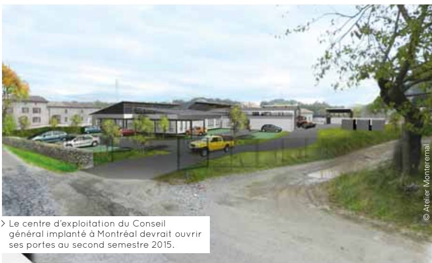
> Le centre d'exploitation du Conseil général implanté à Montréal devrait ouvrir ses portes au second semestre 2015.

* Ces agents travaillaient jusqu'à présent sur trois sites différents implantés à Largentière et Chassiers.