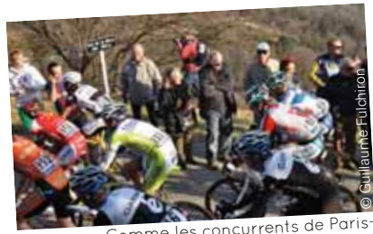
Comme les concurrents de Paris-Nice en 2011, ceux du Critérium du Dauphiné libéré escaladeront le col de Serre-Mure entre Vernoux-en-Vivarais et Saint-Laurent-du-Pape le 10 juin.

Le critérium du Dauphiné libéré fera de nouveau escale en Ardèche deux ans après son dernier passage entre Saint-Félicien et Lamastre. Mardi 10 juin, la troisième étape conduira les coureurs d'Ambert (Puy-de-Dôme) au Teil, en passant par Saint-Agrève, Vernoux-en-Vivarais et Saint-Péray.