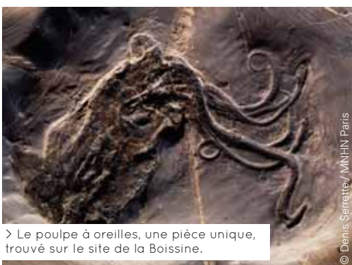
> Le poulpe à oreilles, une pièce unique, trouvé sur le site de la Boissine.