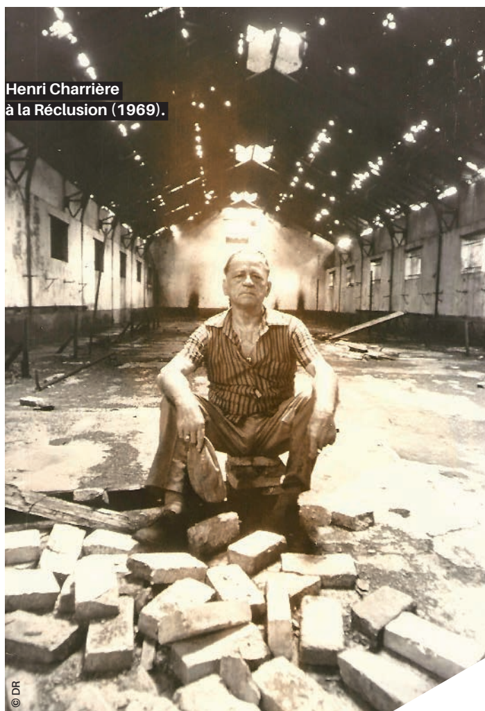
Henri Charrière à la Réclusion (1969).