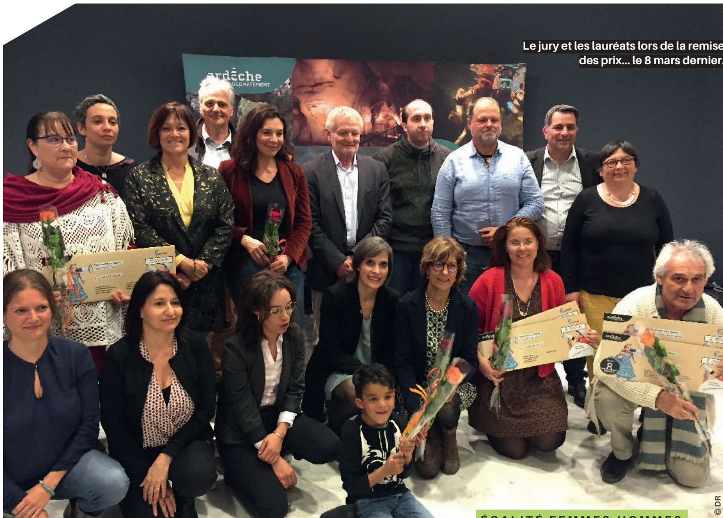
Le jury et les lauréats lors de la remise des prix... le 8 mars dernier.