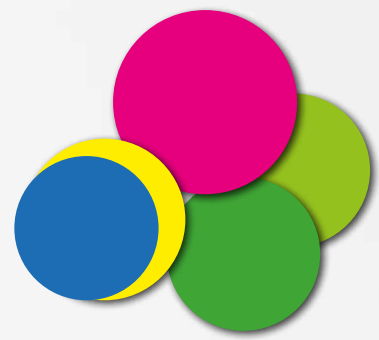
SCHÉMA DÉPARTEMENTAL DES SERVICES AUX FAMILLES DE L'ARDÈCHE

Fort du bilan du 1 er Schéma départemental des services aux familles (SDSF) 2016–2020 au service des parents, de l'éveil et de l'accueil des tout-petits, de la diversité des besoins des familles, du développement de l'enfant, ce nouveau schéma permet de penser l'avenir au service des familles en termes de projets et de leviers d'action.