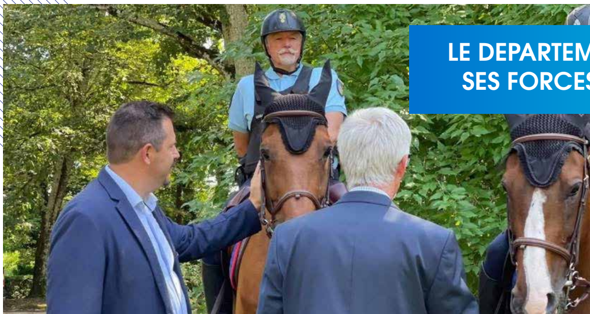
La Département soutient la Gendarmerie nationale dans le déploiement de patrouilles équestres dans les sites touristiques.